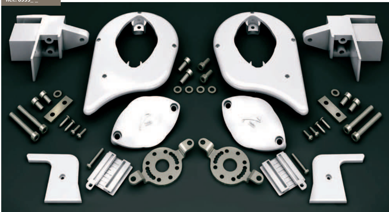
Kit de accesorios Versiplan Plus - Versiplan Plus accessories Kit Kit accessoires Versiplan Plus - Kit Zubehör Versiplan Plus