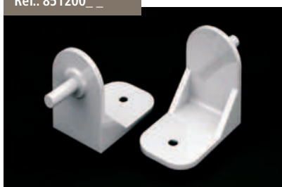
Juego Escuadras Versiplan - Versiplan Squares Kit Kit Escadrons Versiplan - Kit Konsolen Versiplan