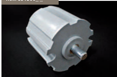
Casquillo Nylon Ø85 Punta con Eje Nylon Ø85 Point with Axis Valve Holder Douille Pointe Nylon Ø85 avec Axe Nylonbuchse Stift mit Achse 85 mm.