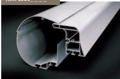
Kit 3 perfiles Versiplan Plus - Versiplan Plus 3 profiles Kit Kit 3 Profils Versiplan Plus - Kit 3 Profile Versiplan Plus