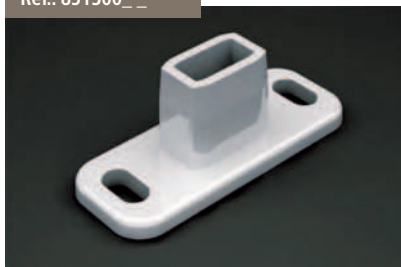
Soporte Versiplan - Versiplan Support Support Versiplan - Halter Versiplan