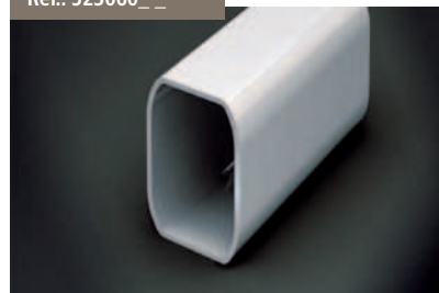
Perfil Pie Versiplan - Versiplan Foot Profile Pied Profil Versiplan - Profil sockel Versiplan