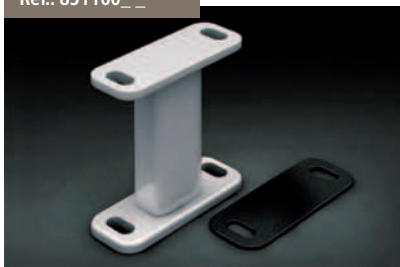
Kit pie Versiplan - Versiplan Support Kit Kit pied Versiplan - Kit sockel Versiplan