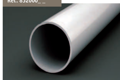
Rodillo Versiplan Ø60 - Versiplan Roll Ø60 Versiplan Rouleau de Ø60 - Profilwalzenrohr Versiplan Ø60